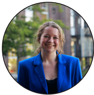
Feline Kaaij Acquisitie

Dit academisch jaar 2024-2025 staat in het teken van "Samenhang in Diversiteit". Bij Polis geloven we in het vieren van de diversiteit van de mensheid en streven we naar een inclusieve leeromgeving waarin iedereen zich gehoord en gewaardeerd voelt. We nodigen uit tot dialoog en reflectie over belangrijke onderwerpen zoals dekolonisatie, intersectionaliteit en ruimtelijke rechtvaardigheid. Onrechtvaardigheden beïnvloeden de toegang tot de gebouwde omgeving en de kwaliteit van leven, en het is onze missie om door bewustwording en educatie bij te dragen aan een inclusievere en rechtvaardigere samenleving.